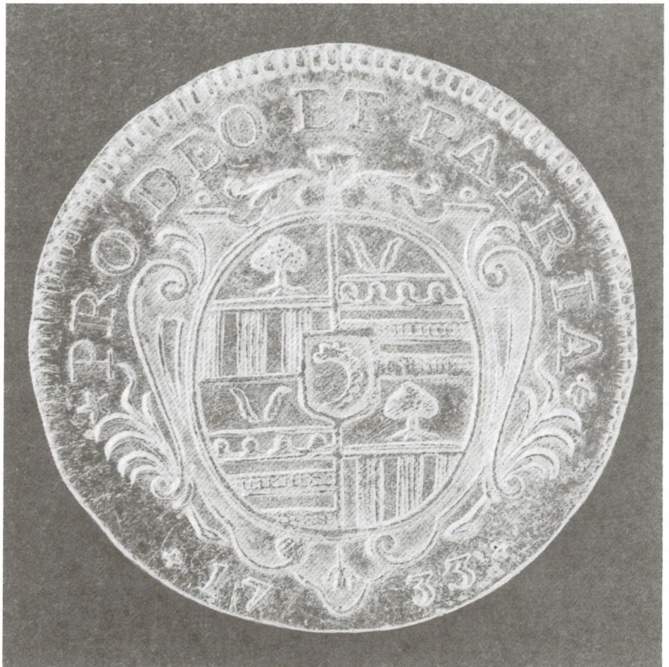
Golddukat von Gubert von Salis-Haldenstein, 1733. – Rückseite mit dem Wappen der Freiherren von Salis-Haldenstein und der Umschrift: PRO DEO ET PATRIA. 1733.

Im weiteren stellt der Bund heute fest, dass ihm grosse Landwirtschaftsflächen fehlen. Flächen, die im Kriegsfall eine minimale Selbstversorgung sicherstellen sollten. Er appelliert nun an die Kantone, das