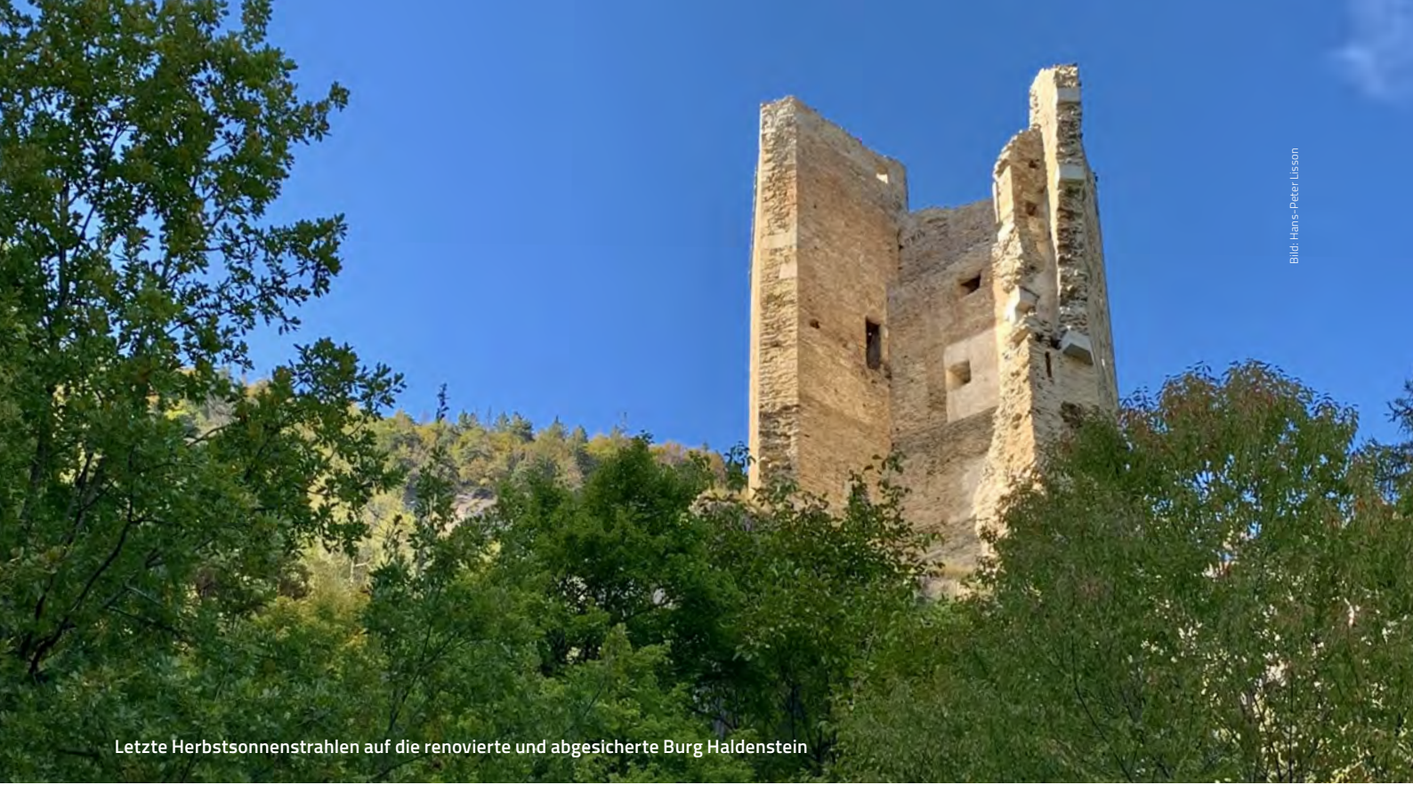
Letzte Herbstsonnenstrahlen auf die renovierte und abgesicherte Burg Haldenstein