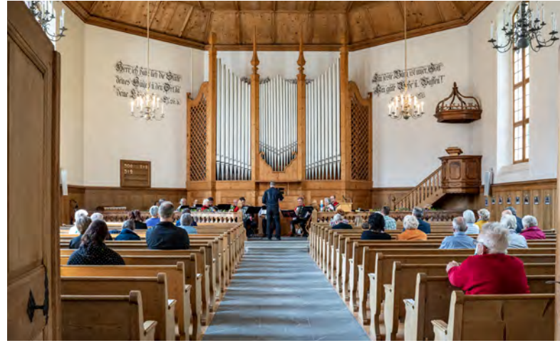
Ein einladender Blick...