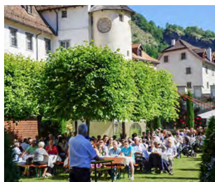
Bürgertreffen Schloss Haldenstein 11. Juni 2017