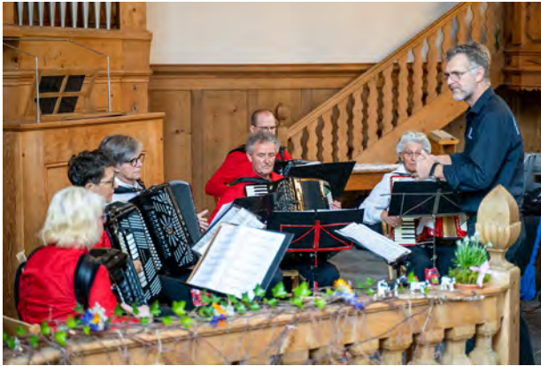
Der Handharmonika Club Chur konzentriert bei der Sache