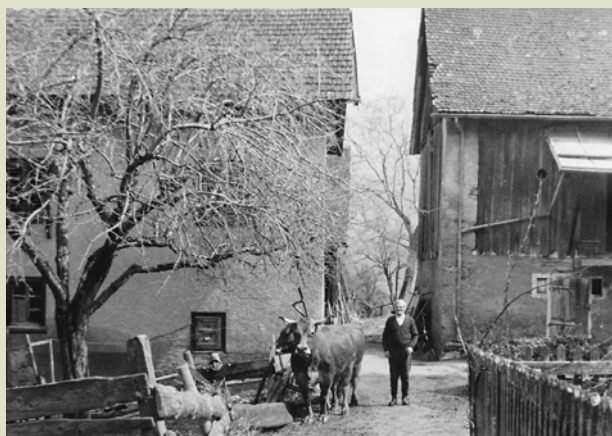
Simi Walser-Lütcher, im Bongert, führt seine Kühe zum Brunnen im Süesswingel