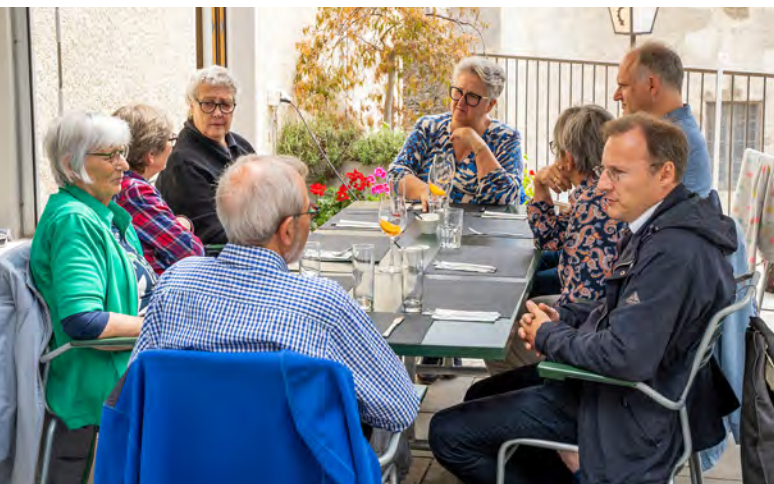
Warten auf Speis und Trank