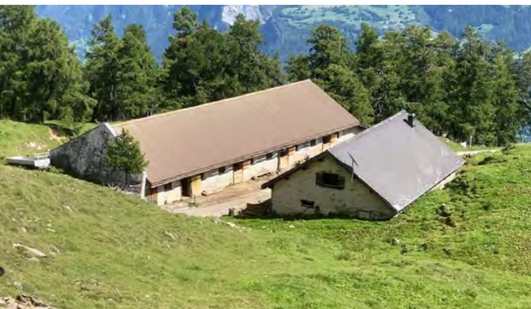
Neusäss – Die wilde Jungviehalp