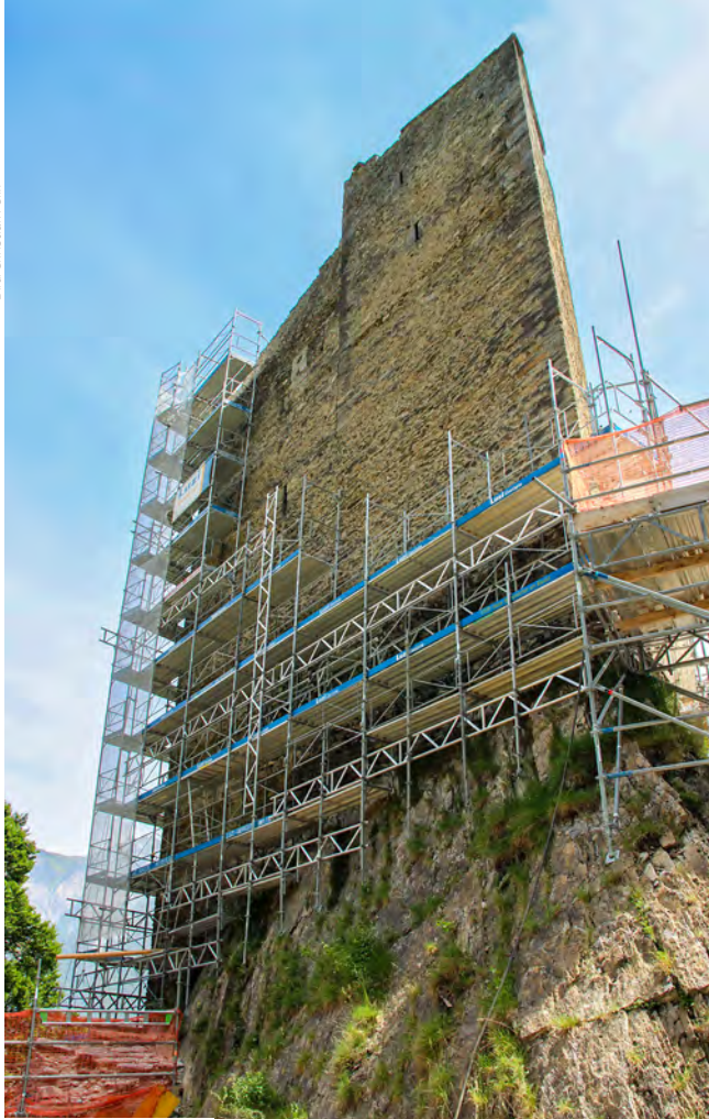
Burg Haldenstein kurz vor dem Abschluss

«Ein dreieckiger Turm!» Aber bald wird dem Bischof klar, dass er damit einen ganz besonderen Turm hätte. Das gibt es bis dato in den umliegenden Tälern noch nicht.