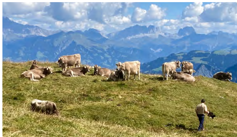
Wolfegg, Mittagspause mit Aussicht

Mutterkühe mit den jungen Kälbern, ein vielfarbiges Bild verschiedener Viehassen. Im oberen Teil geniesst das Galtvieh die feinen und kräftigen Alpenkräuter – «Ein Hut voll davon enthält Kraft für einen Tag», meint Peter. Dieses Jahr wäre noch Futter für weitere zwanzig Tiere vorhanden. Bezüglich der Biodiversität gehört das Neusäss zu den zehn bestplatzierten Alpen in Graubünden, das Altsäss nimmt sogar den Spitzenrang ein. Beim grünen Gras für die Milchkühe des Altsässes spielt die Eiweisszufuhr zur Milchproduktion die Hauptrolle. Durch ihre Höhenlage haben die Bündner Alpen einen besonderen Charakter. Beim Rückweg über die Weiden des Altsässes, richtet sich der Blick auf die höher gelegene Calanda Hütte SAC. Die Ziegen sind bereits selbständig im Neusäss angekommen und warten auf eine Handvoll Zuckerrübenschnitzel. Der weitere Kontrollgang erfolgt westwärts hin zur angrenzenden Felsberger Alp mit dem Quad. Die Gemeindegrenze zu Felsberg verläuft entlang des Haldensteiner Tales bis auf den Grat. Diese verschiedenen Geländekammern sind nicht einfach zu überblicken. Es ist eine Eigenheit der Tiere, dass sie sich auch auf der Alp in ihrer heimischen Gruppe aufhalten.