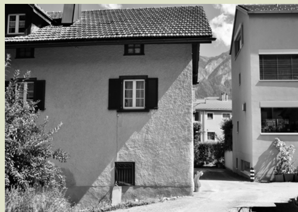
Ruhige, gemütliche Ecken