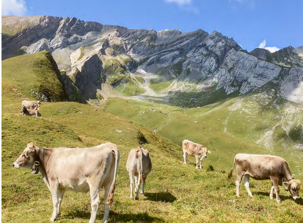
Weiden unter den Calandafelsen

Die erste Weide beginnt auf den dorfnahe Wiesen der Böfel. Dann folgt der Aufstieg über die nächsten Vegetationsstufen zwischen dem Foppbrünneli und Unterfopp zum Schindelboden, nach Oberfopp und Arella. Das Gras jeder dieser vier aufsteigenden Abschnitte von jeweils 200 Höhenmetern, genannt Koppelweiden, reicht für etwas mehr als eine Woche. Durch das stete Ansteigen der Frühlingsvegetation bleibt die Qualität des Grases konstant. Diese eingezäunten Koppelweiden dienen dem Erhalt einer grossen Lebensvielfalt. Der Unterhalt dieser Flächen mit wertvollen Trockenwiesen ist in ein Vernetzungsprojekt der Bauern eingebunden. Der Schutz vor einer Verwaldung dient nicht nur der Futterproduktion. Die Biodiversität und der Schutz vor Bodenerosion und anderer Naturphänomene ist mitentscheidend.