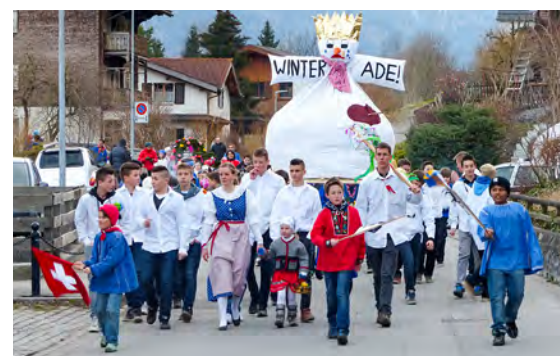
Frühlingsumzug 21. März 2013