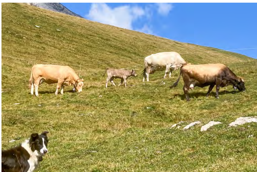
Friedliches Weiden unter Aufsicht

Die Flurnamen Wolfegg oder Bärenhag weisen auf den früheren Aufenthalt von Grossraubtieren hin. Das Haldensteiner Wolfsrudel ist seit langem schweizweit bekannt. Leider kam es anfangs September zu einem grösseren Zwischenfall mit Wölfen. Diese haben für grosse Unruhe im Haldensteiner Tal gesorgt. Kälber aus Felsberg wurden in der Haldensteiner Herde gesichtet. Die Tiergruppen haben ihre familiären Strukturen verlassen und einige Tiere flüchteten in das Tobel unterhalb dem Talhüttli in Richtung des darunterliegenden Schiessplatzes. Bei der grossen Nässe wurde dies für die Tiere sehr gefährlich. Bis spät abends und am folgenden Morgen mussten diese Tiere mit dem Helikopter in Sicherheit gebracht werden. Mit Mutterkühen und Kälbern ist dies keine einfache Angele-