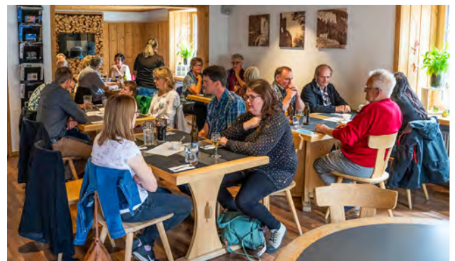
Geselligkeit bei Röbi