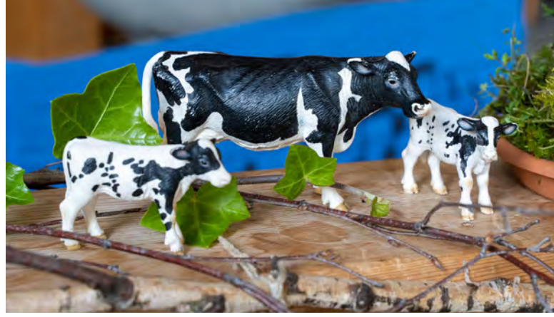
Auch die optischen Präsentationen gefielen