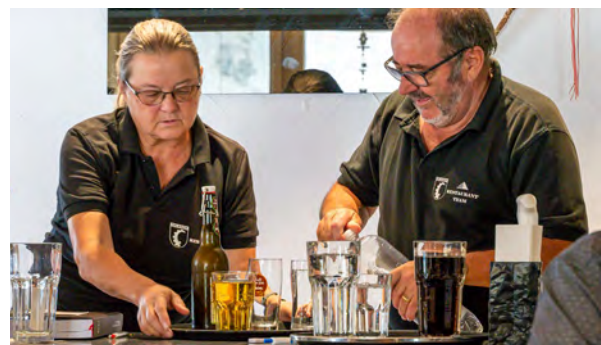
Alle Hände voll voll zu tun...