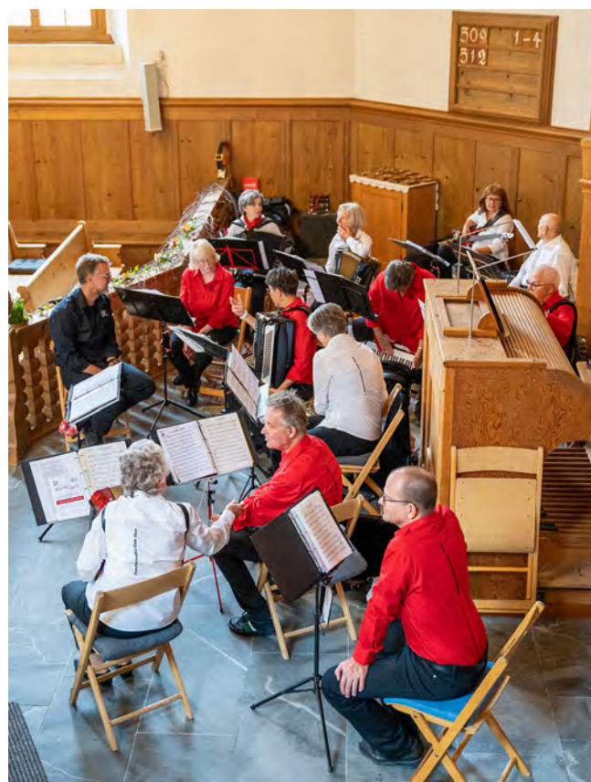
Kurzer Austausch über das Gespielte

Dank dem Einsatz der Beteiligten sowie den Festpersonen gelang das Ersatzprogramm durchaus. ■