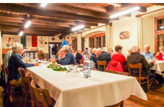
«Bei Speis und Trank» Traditionelle Martini-Suppe im Schloss Haldenstein 2021