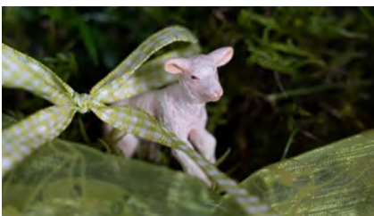
Auch kleine Dinge haben Seelen