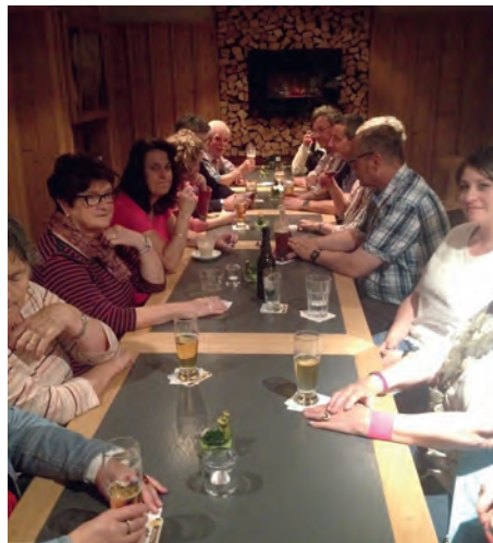
Die Sänger vom Gemischten Chor lieben die Geselligkeit im «Calanda»

kunstvoll komponierten Beilagen versehen. Verführerische Desserts wie Zwetschgknödel runden das Angebot ab. Der «Frühtagsplausch» soll noch bekannter werden und auch neue Gäste anziehen.