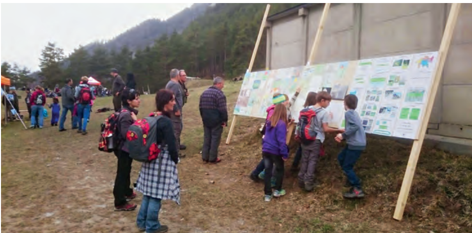
Die Zeichnungen der Schülerinnen und Schüler werden während des Erlebnistages bewertet