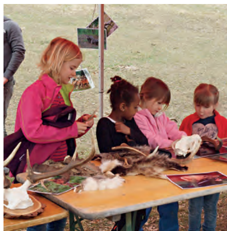
Wie fühlt sich ein Geweih oder ein Fell an?