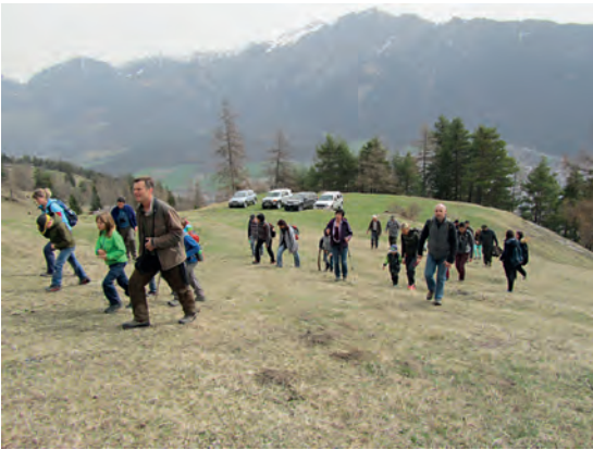
Wir nähern uns dem zweiten Hegeposten