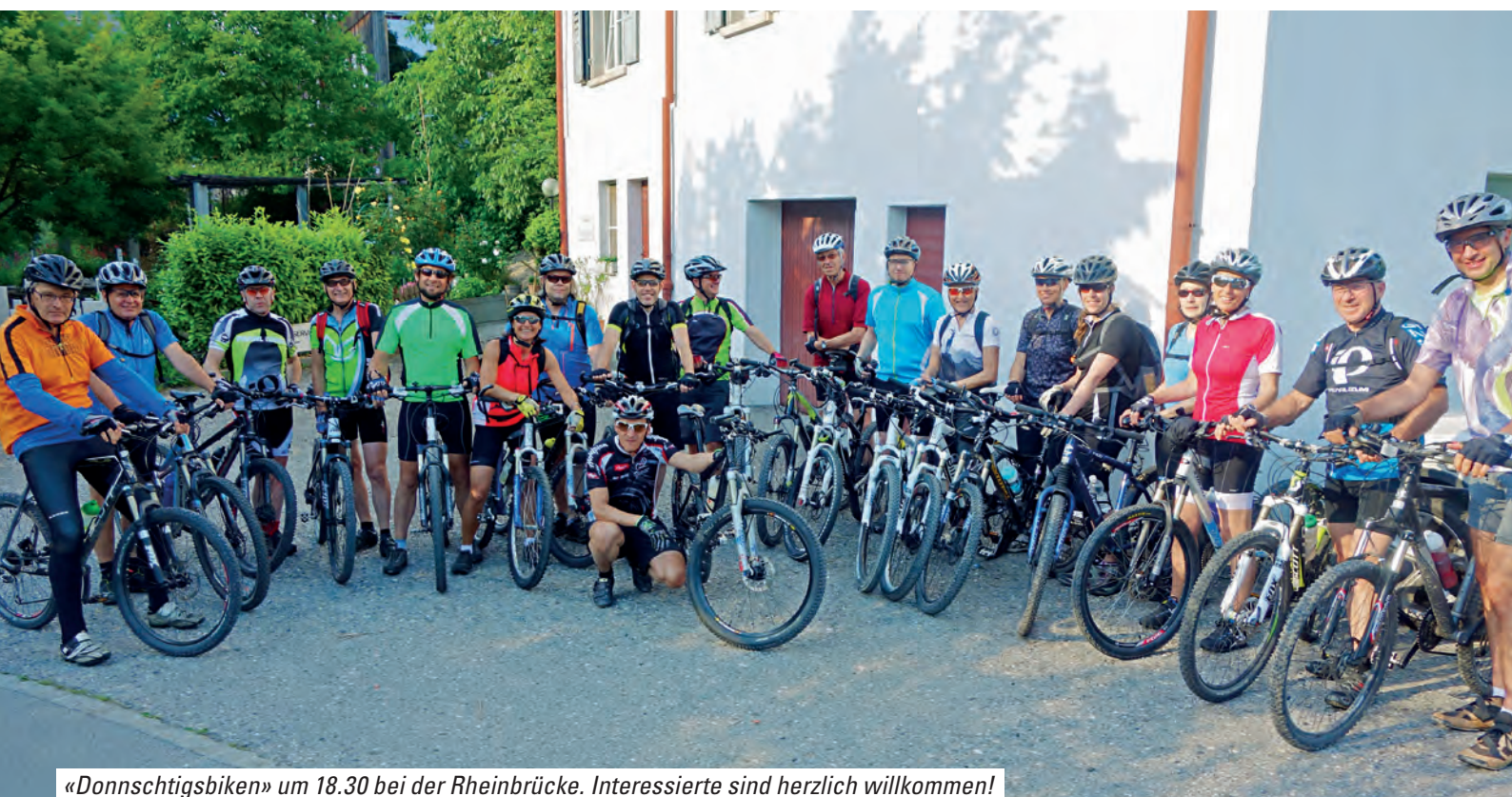
«Donnschtigbiken» um 18.30 bei der Rheinbrücke. Interessierte sind herzlich willkommen!