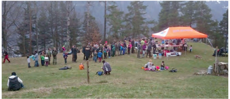
Mittagessen auf dem Schindelboden