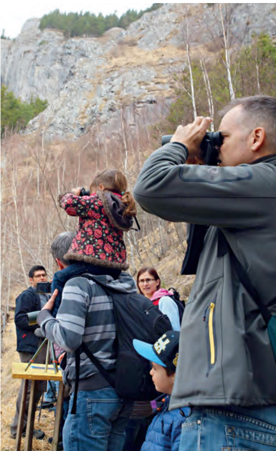
Gespannt wird nach Steinböcken und Gämsen Ausschau gehalten

Somit geht der Erlebnistag mit Förster und Jäger auf Arella zu Ende. Der Titel des Anlasses hat die Erwartungen der Teilnehmenden hoch gesteckt. Aus vielen Gesprächen vor Ort, der guten Stimmung am Anlass und den diversen positiven Rückmeldungen zu Folge wurden diese erfüllt. Es war wirklich ein Erlebnistag für Jung und Alt. ■