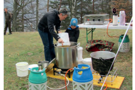
Die Suppe wird vorbereitet

Mit viel Engagement bereiteten die Jäger und ihre Angehörigen am Freitag