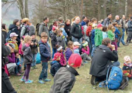
Teilnehmer hören gespannt den Ausführungen bei der Begrüssung zu

Der Titel des Anlasses steckt die Erwartungen der Teilnehmenden hoch. Viele sind gekommen, von Haldenstein aber auch von den umliegenden Gemeinden. Manche kennen die Jagd oder den Forst aus ihren Familien, andere hatten noch kaum Kontakt mit dem Thema. Alle Teilnehmenden halten sich jedoch gerne in der Natur auf und möchten deshalb noch mehr erfahren oder vielleicht noch einen anderen Einblick erhalten.