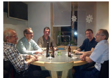
Turnen macht Durst, der Stammtisch