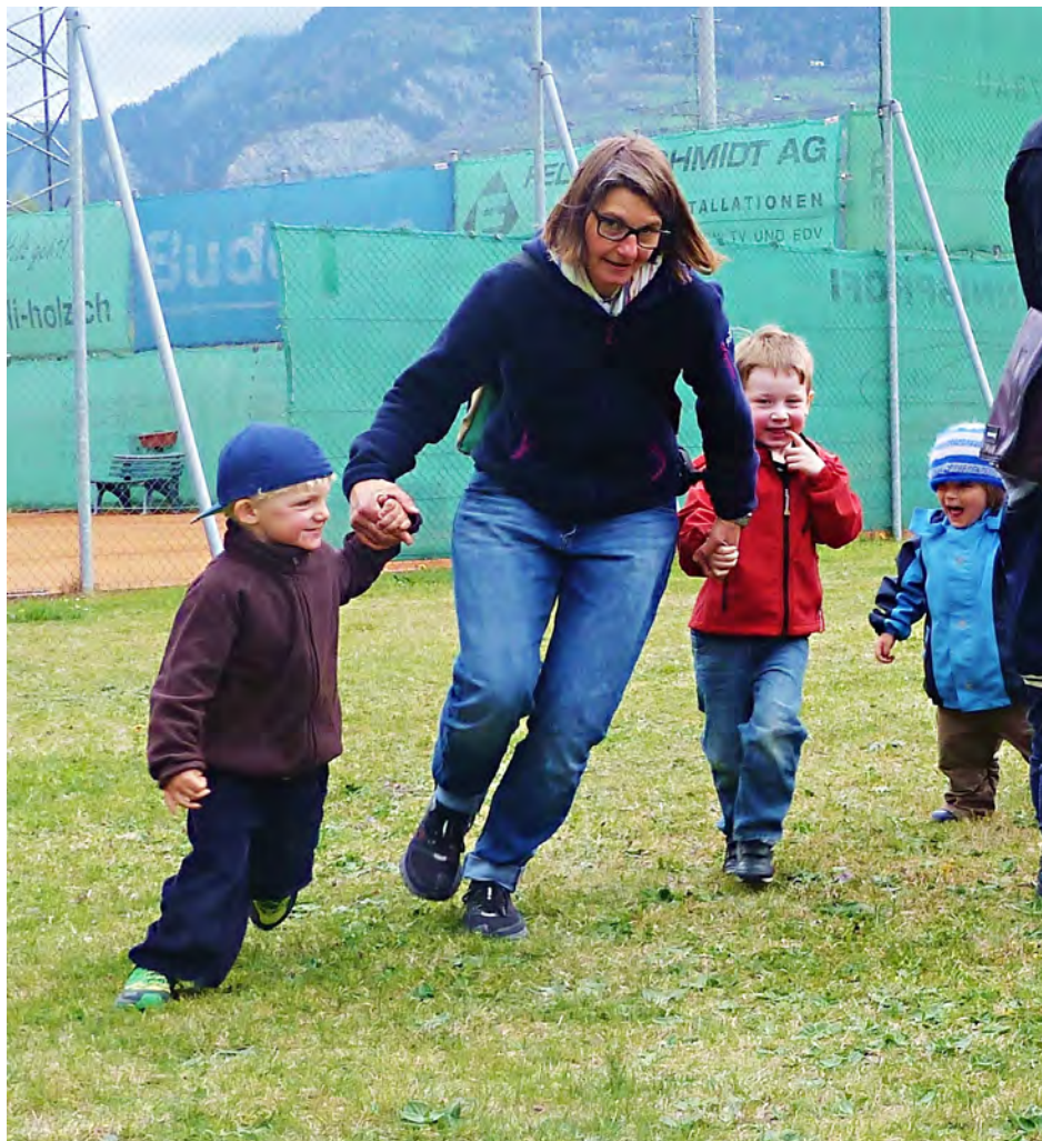
Voller Einsatz beim Mukiturnen