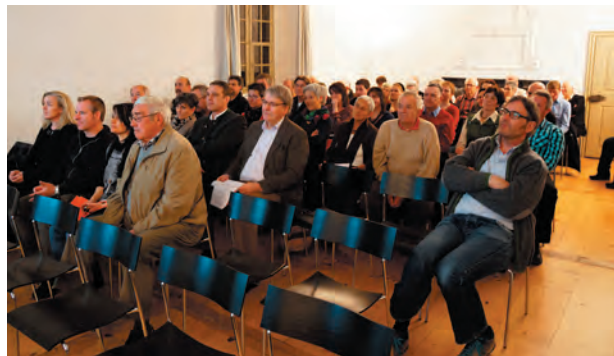
Nach Art. 19, Absatz 3 der Statuten der Bürgergemeinde Haldenstein ist die Bürgerversammlung für die Verleihung des Ehrenbürgerrechts zuständig.