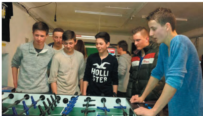
Gespanntes Zuschauen beim «Schnellschuss»