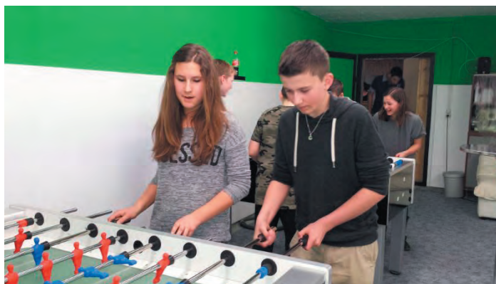
Gute Stimmung bei den Jugendlichen