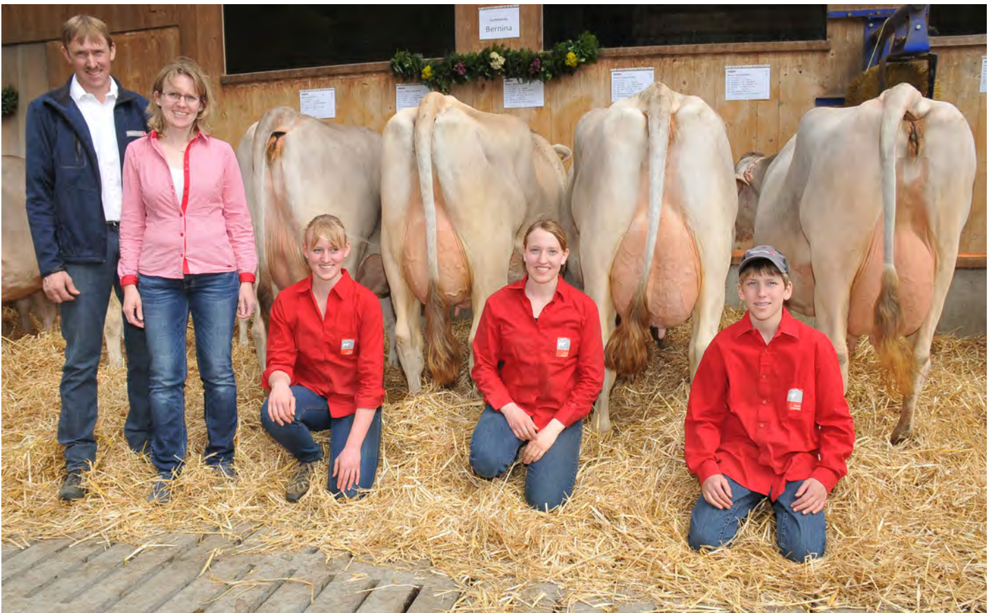
Familie Walser mit Zuchtfamilie von Kuh Bernina