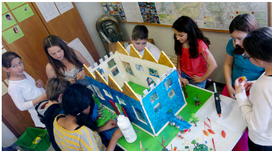
Die Schüler fertigen das Wettbewerbsmodell in minutiöser Kleinstarbeit

Was sie auf ihrer zweitägigen Schulreise erleben, berichten uns die glücklichen Gewinner in der kommenden Herbstausgabe des Haldensteiner Boten. ■