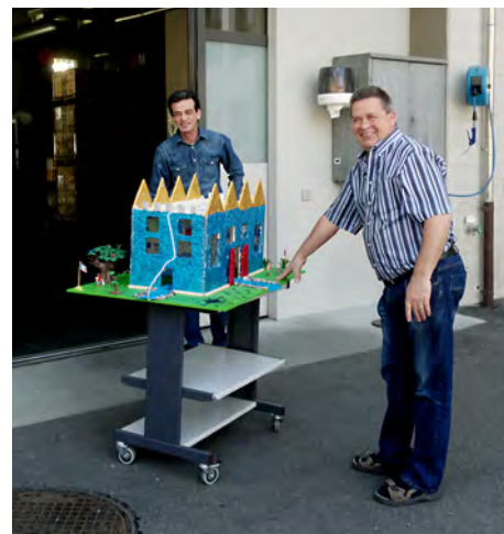
Geschafft! Das Wasserschloss wird von Mitarbeitern des Bundesamtes für Landestopographie entgegen genommen.