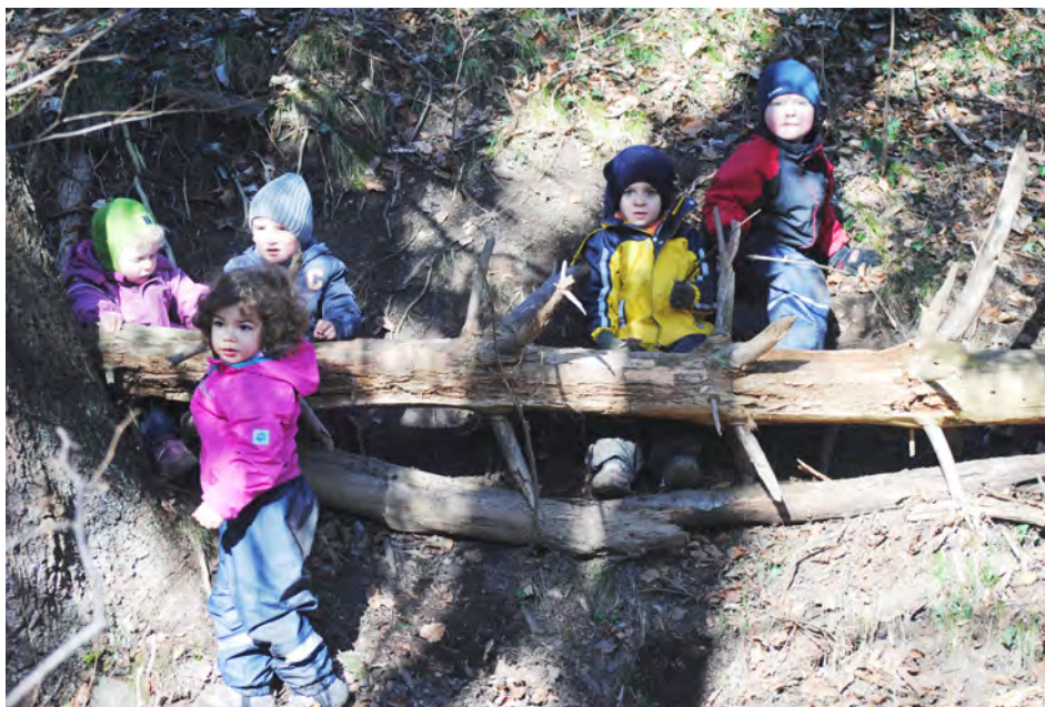
Kinder der Waldspielgruppe Schatzkiste in Aktion

nen wird gemeinsam mit den Kindern entschieden, was gemacht wird z. B. mit einem Ball spielen, über ein Bänkli rutschen, auf der grossen Matte herumturnen, etc. Ein vorgegebenes Programm gibt es nicht.