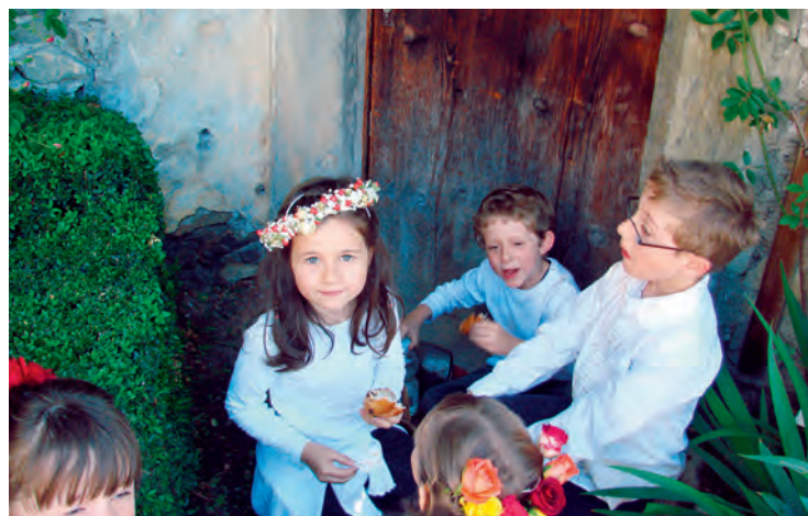
Schülerstimmen öffnen die Herzen der Festivalbesucher