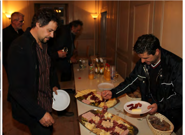
Nach speditiver Behandlung der kurzen Traktandenliste konnte man sich dem von André Fils gestifteten Apéro zuwenden.