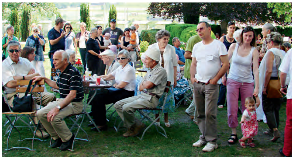
Gartenfreunde sind gesellige Menschen