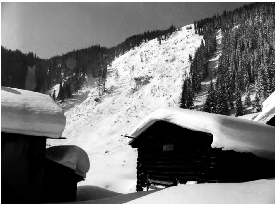
Lawine in Batänja 1976

Im Winter 1976 mussten wir wegen den Lawinen die Tiere mit dem Helikopter hinunter bringen. Die Lawine zerstörte die Wasserleitung. Ich meldete dem Kanton, eine Lawine sei gekommen, wir bräuchten einen Helikopter und Hilfe. Da hiess es, das komme nicht in Frage, am Calanda sei keine Lawine gekommen. Da telefonierte ich dem Bundesrat Ritschard in Bern. Er sagte: «Am Nachmittag um 14 Uhr sind zwei Militärhelikopter in Oldis und ein