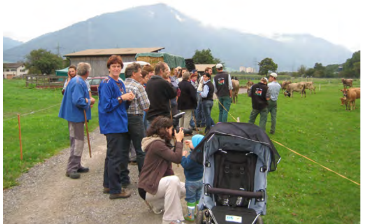
Es dauert nicht mehr lange, und die Haldenstreiner Bauern können ihr Vieh in Empfang resp. nachhause nehmen.