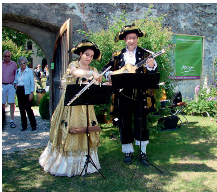
Klassik im Renaissance-Schloss