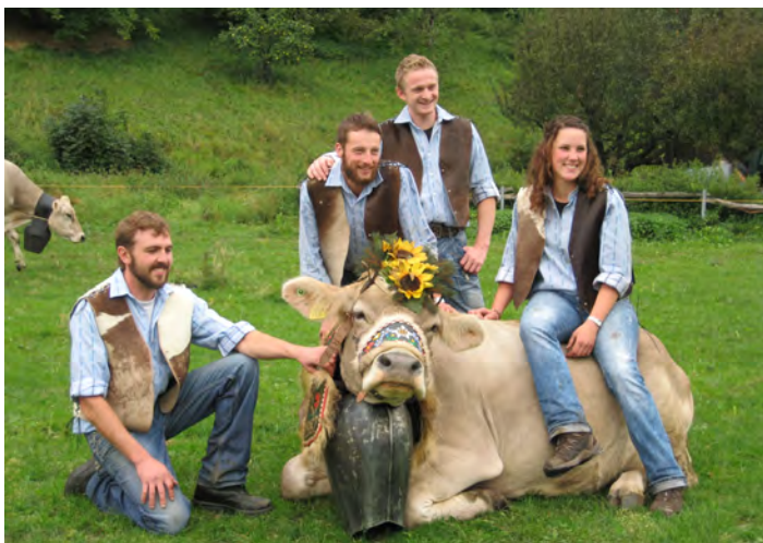
Letzte Erinnerungsfotos des Personals nach getaner Arbeit auf der Haldensteiner Alp.

Untrügliches Zeichen, dass der Sommer vorbei ist: