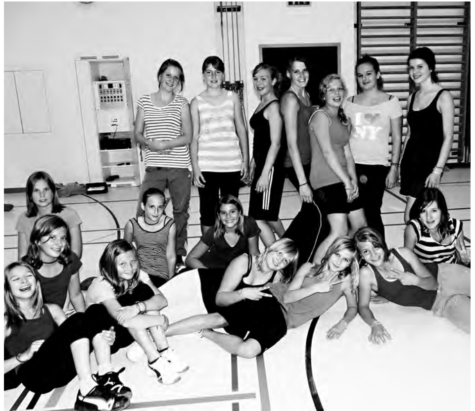
Die Haldensteiner «Aerobic-Truppe»

Aerobic ist ein dynamisches Fitness-training in der Gruppe mit rhythmischen Bewegungen zu motivierender Musik. Die Grundelemente sind hauptsächlich Ausdauer und Koordination. Die in einer Choreographie zusammengestellten Übungen sind eine Mischung aus klassischer Gym-