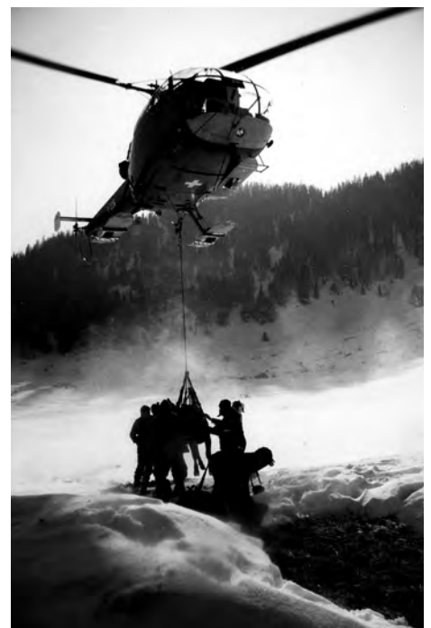
Rettung mit dem Helikopter