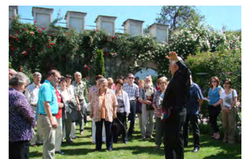
Kulturmix, Gartenhandwerk und Helferteam tragen zum Erfolg des Gartenfestivals bei