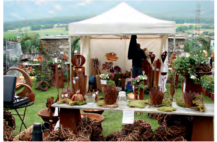
Überzeugendes Pflanzen- und Gartenangebot