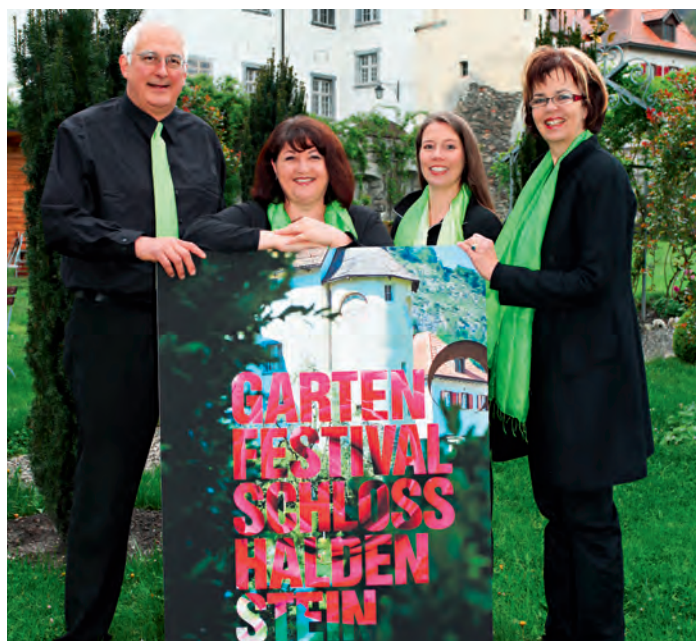
Ein sichtlich gutgelauntes Organisationskomitee